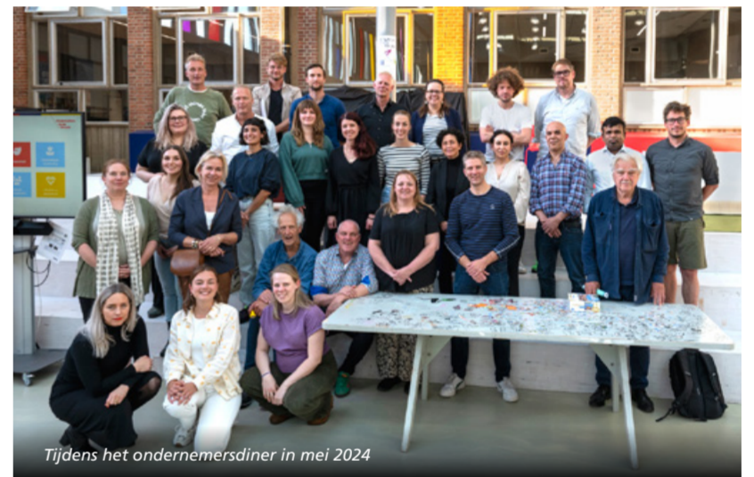
Tijdens het ondernemersdiner in mei 2024

Om ondernemers en organisaties in het gebied met elkaar te verbinden organiseert het Kernteam in 2024 twee